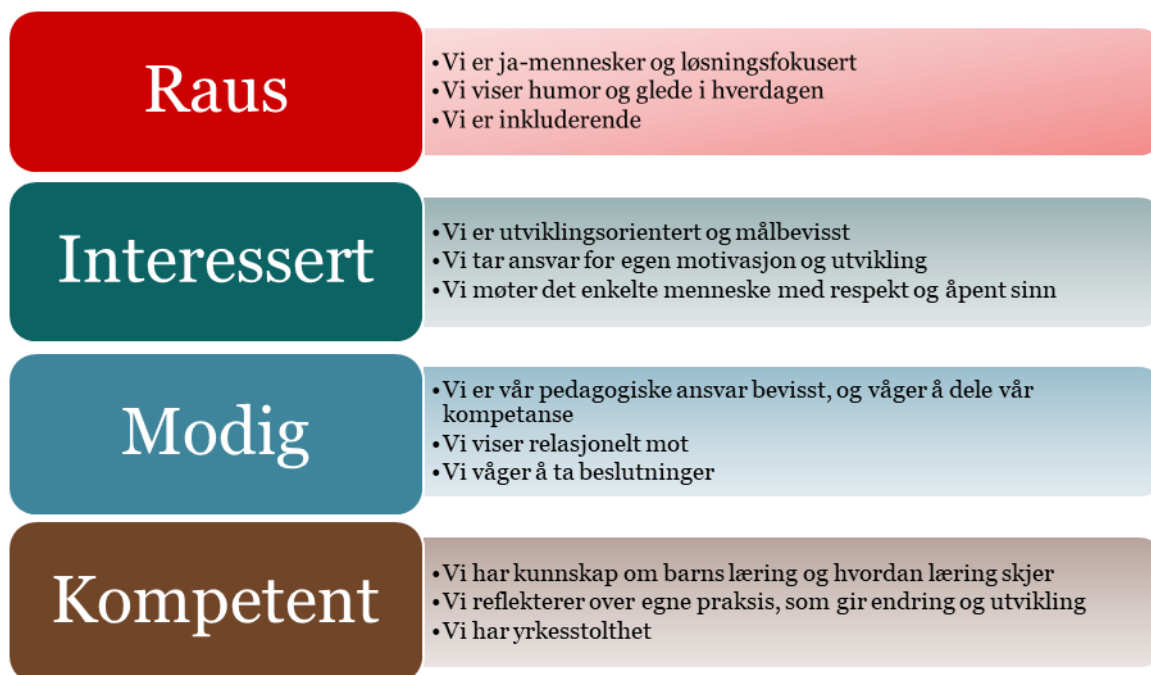
Figur 2: Oversikt over hva kommunens verdier betyr for barnehagens ansatte.